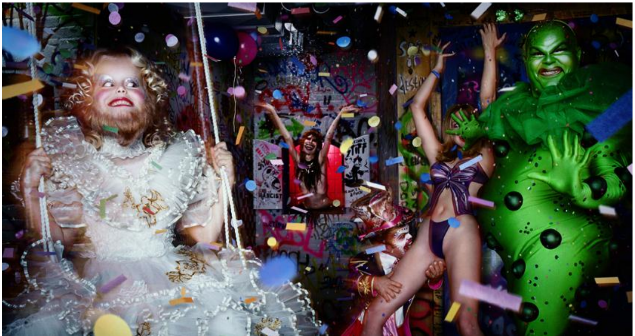
« Paradise The Club » – Dressing Room, 2001

www.rabouan-moussion.com rabouanmoussion@noos.fr