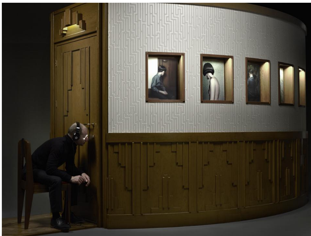
Vue de l'installation « The Keyhole », 2011, © Erwin Olaf

La Sucrière - Lyon Du 21 mars au 30 juin 2013