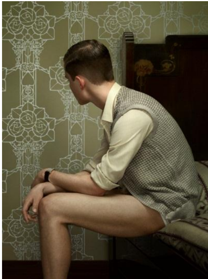
« The Keyhole », photographie, 2011 © Erwin Olaf

2001 - Silver Lion award pour la publicité Heineken