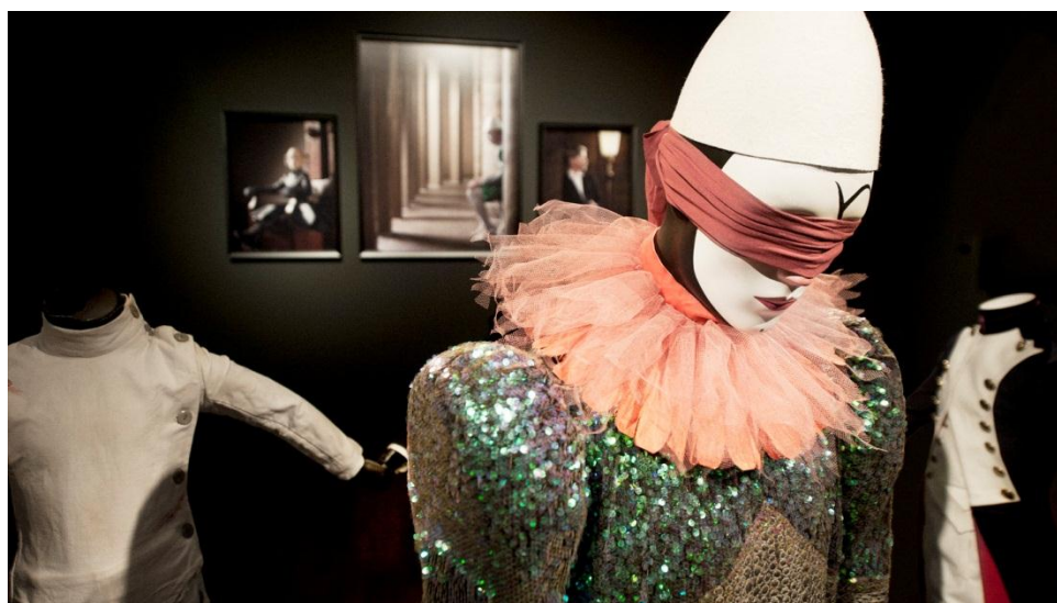
« Berlin », vue de l'installation Karussel Berlin, Museum of Modern Art, Ahrnem (NL) 2012 © Erwin Olaf

L'installation « Karussel Berlin » et plusieurs photographies de la série « Berlin » sont présentées pour la première fois en France à l'occasion de l'exposition à La Sucrière.