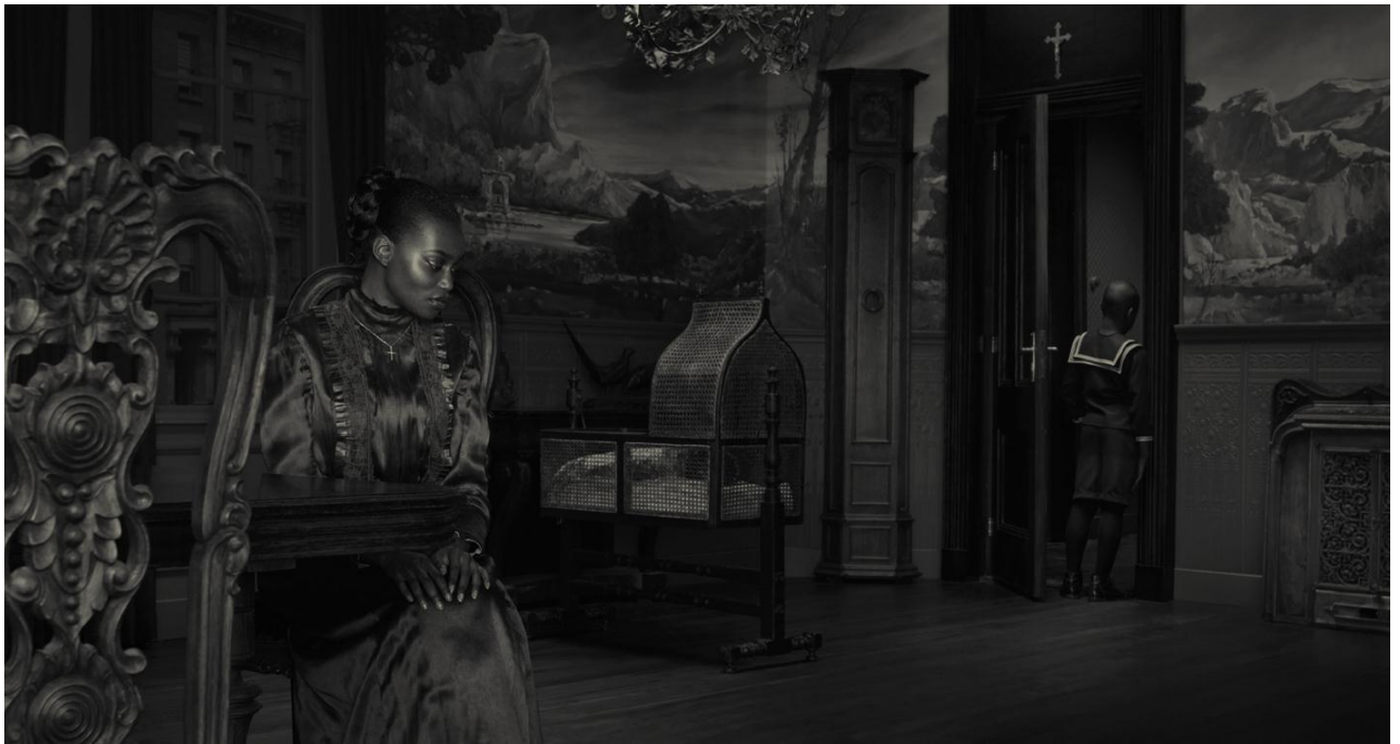
« Dusk », photographie, 2009 © Erwin Olaf