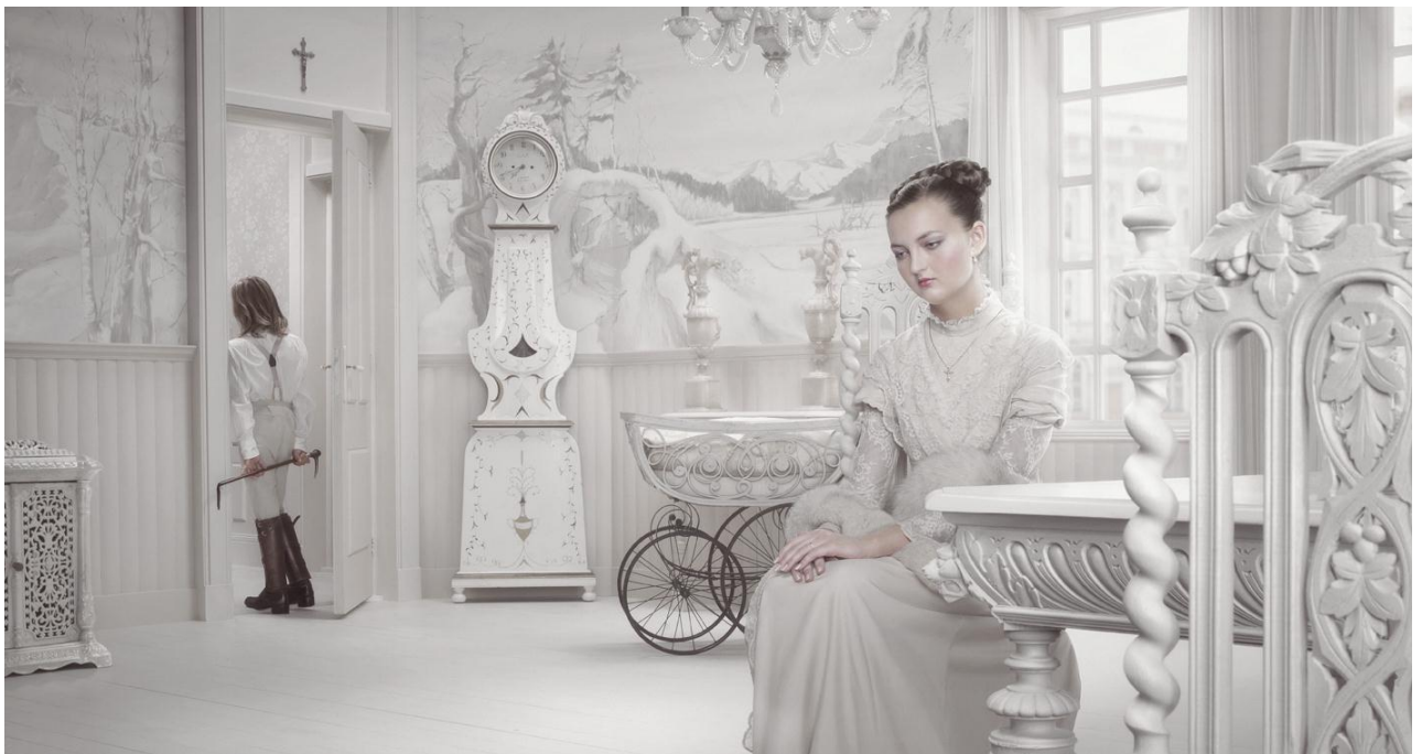
« Dawn », photographie, 2009 © Erwin Olaf